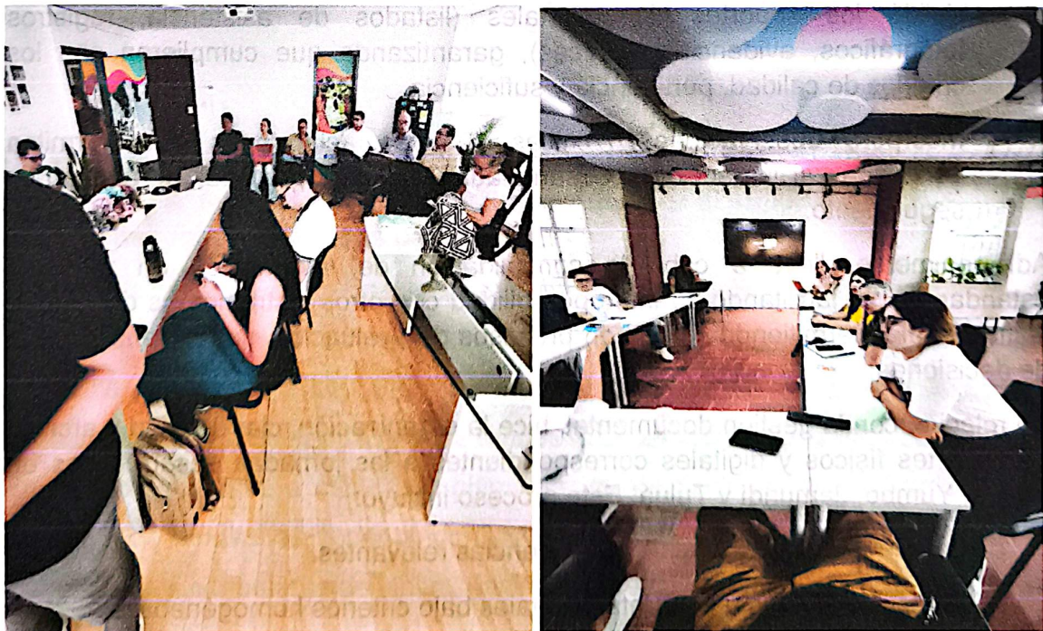
(Reunión equipo de trabajo subsecretaría de desarrollo, SADS)

Asimismo, hice seguimiento continuo a los compromisos adquiridos, garantizando su cumplimiento dentro de los tiempos establecidos. Esto permitió fortalecer la eficiencia en la ejecución y asegurar el logro de los objetivos planteados en el Plan de Desarrollo.